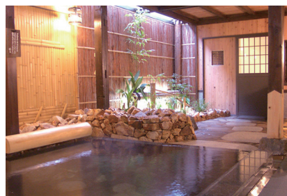
テーマ別でめぐる1日ツアー