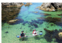
クリアカヤック (2名~)