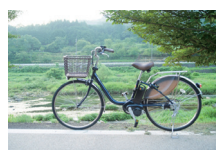
レンタルサイクル（1日）