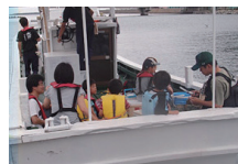
ファミリーフィッシング （2名〜）