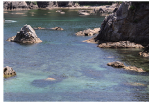
ジオの海水で天然塩作り