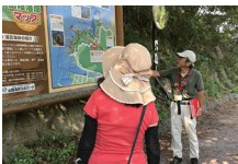
ガイド付き 海岸沿いウォーキング