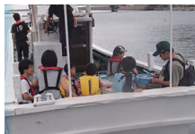
ファミリーフィッシング (2名～)