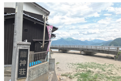
ゆったり長期滞在プラン