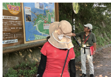
ガイド付き 海岸沿いウォーキング