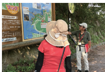
ガイド付き 海岸沿いウォーキング