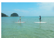
スタンドアップパドル