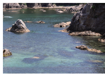
ジオの海水で天然塩作り