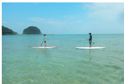
現地「乗り物&アクティビティ」チョイス