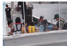
ファミリーフィッシング (2名~)