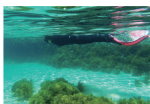
シュノーケリング